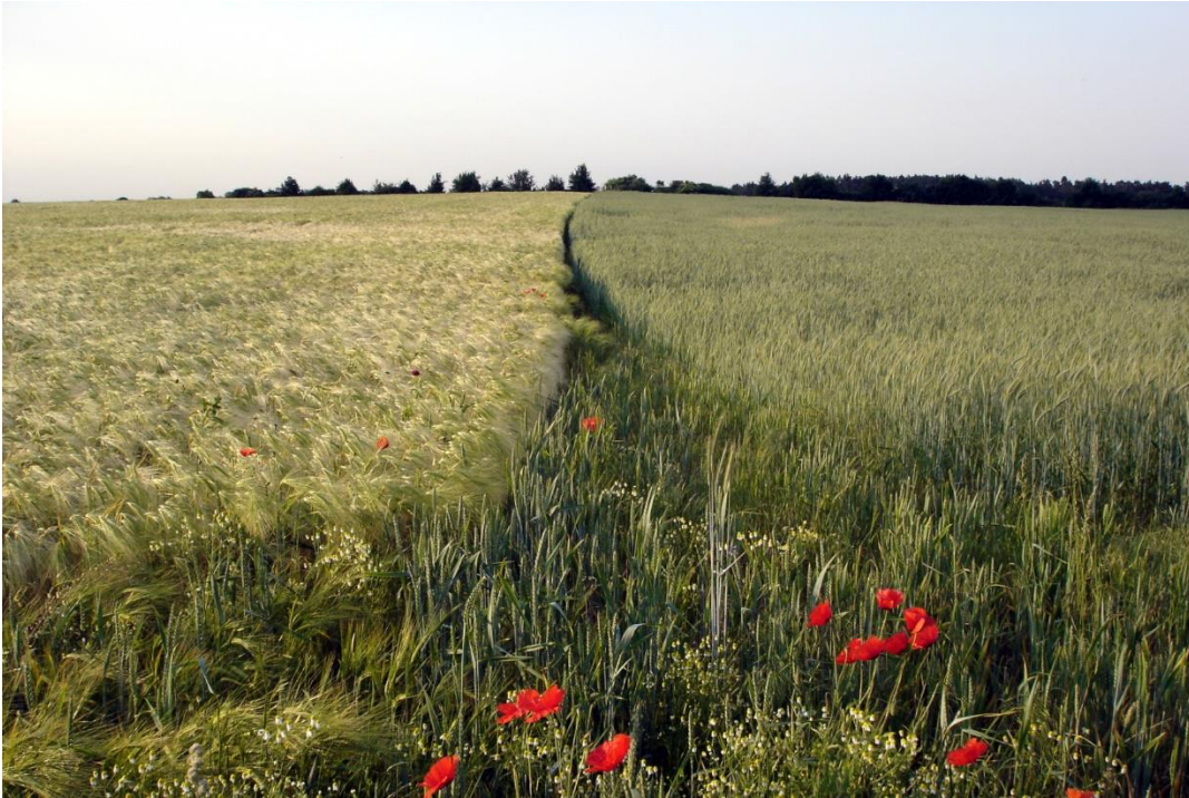
Gerste neben Roggen: Bald können Getreidearten vom Satelliten aus unterschieden werden. | Quelle: © Claas Nendel / ZALF | Bildquelle in Farbe und Druckqualität: http://www.zalf.de/de/aktuelles